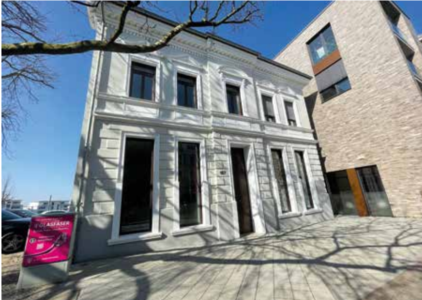
📍 Das imposante Gebäude in der Hauptstraße 185 in Heiligenhaus – im Erdgeschoss die Geschäftsräume von Hörakustik n.reinders

Es war von Anfang an ein Verhältnis, das ich so nicht erwartet hätte. Ein Geschäftsführer, der sich für mich Zeit nimmt, der mich an die Hand nimmt und sagt: »Wir gehen diesen Weg jetzt gemeinsam.« Das war die Aussage, die ich nach wie vor verinnerlicht habe. Auch weil ich feststelle, dass das nicht irgendwann endet. Es kam kein Punkt, an dem es hieß: »So, jetzt hast du eröffnet, und ab sofort geht es darum, viele Hörgeräte zu verkaufen, damit Geld fließt.« Stattdessen gibt es immer neue Angebote, die meine Marke etablieren helfen und meine Kompetenz als Inhaber weiterentwickeln. Und ich selbst kann frei entscheiden: Ist das, was mir angeboten wird, aktuell meine Baustelle, oder sind es andere Punkte, die aus meiner Sicht Priorität haben. Eine andere Stärke des IAS ist, dass sie nicht so konventionell ist. Die traditionellen EKGs sind alle etwas träge. Der IAS hingegen ist schnell. Es gibt ein Klima, in dem sich junge Gründer richtig fühlen. Ich bin immer wieder begeistert, wie viele junge Akustiker sich hier versammeln. Das ist nicht mehr die Generation, die ihr Geschäft früher oder später verkaufen will. Es sind Leute, die noch viel erreichen wollen. Ich finde das fantastisch – auch für unser Handwerk. Es ist das, was die Hörakustik braucht.