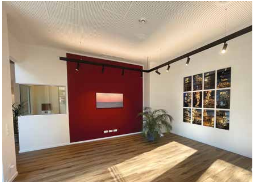
📍 »Sicherlich hätte ich auch mit einem Viertel der Fläche loslegen können« – Blick in die Geschäftsräume von Hörakustik n.reinders

Straßen weiter wäre es deutlich günstiger gewesen. Aber der Ort hier war von Anfang an so, dass ich sagen konnte: Hier bleibe ich. Eigentlich bin ich keiner mit riesigem Ego. Aber da war ich mir absolut sicher. In diese Räume will ich hineinwachsen. Denn natürlich ist es nicht das Ziel, hier dauerhaft zu zweit zu bleiben. Im besten Fall stellt sich im Einzugsgebiet irgendwann nicht mehr die Frage, wohin man geht, wenn man gut versorgt werden will.